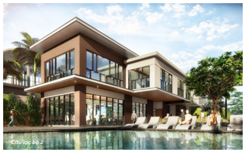
Cầu lạc bộ 2