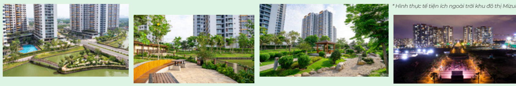
* Hình thực tế tiện ích ngoài trời khu đô thị Mizuki