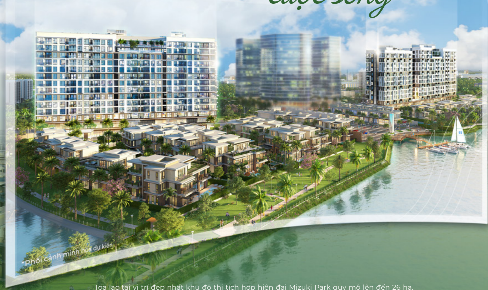
* Phối cảnh minh họa dự kiến

Toạ lạc tại vị trí đẹp nhất khu đô thị tích hợp hiện đại Mizuki Park quy mô lên đến 26 ha, Flora Panorama được thiết kế theo phong cách nhiệt đới đương đại mới lạ và khác biệt, mở ra một không gian sống đẳng cấp xứng tầm các chủ nhân danh giá.